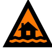
متوجه باشید و اقدام کنید