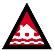
ဂ့ၢ်ဂီၢ်အူအတၢ်ဟ့ၣ်ပလီၢ်

နဂ့ၢ်ဂီၢ်အူတၢ်တီၢ်ကျဲၤမ့ၢ်အိၣ်တခီ မၤပိၣ်ထွဲ အီၤတက့ၢ်. ကွၢ်ဘၣ်န Vic Emergency App ဒီးဒိကန့ၣ်ဘၣ် ဂ့ၢ်ဂီၢ်အူတၢ်ရၤလီၤတၢ်ကစီၣ်သန့ဒ်သိး - ABC Local 91.1FM, Gold 107.1AM and 98.3FM, Hit 91.9FM, Triple M 93.FM, KLFM 96.5FM ဒီးဒိကန့ၣ် ကွၢ်စူၣ်ဘၣ် တၢ်ဟ့ၣ်ပလီၢ်သ့ၣ်တဖၣ်န့ၣ်တက့ၢ်.