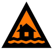
ကွၢ်ဒီးမၤပိၣ်ထွဲ

တၢ်ပနီၣ်အံၤတၢ်သူအိၣ်ဒ်သိးကတဲနၤလၢ လီၤကဝီၤန့ၣ်ထံလီၤသံးလံဒီးတၢ်လီၤ ဘၣ်ယိၣ်စ့ၤလီၤလံသ့ၣ်စ့ၤကိးန့ၣ်လီၤ.