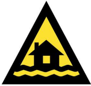
တၢ်ဟ့ၣ်ကူၣ်ဟ့ၣ်ဖး

တၢ်ဟဲကဲထီၣ်သးလံ ဘၣ်ဆၣ်တၢ်လီၤ ဘၣ်ယိၣ်ဖဲတကီၢ်ခါအံၤတအိၣ်ဒီးဘၣ်. ဟံၣ်န့ၣ်တၢ်ဂ့ၢ်တၢ်ကျိၤဈးဆါဈးကတီၢ် ဘၣ်သ့ၣ်သ့ၣ်တၢ်အိၣ်သးကဆီတလဲသး အယံၤ.